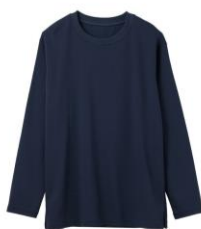
クルーネック長袖 15,400円(税込)