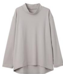
ハイネック長袖 15,400円(税込)