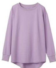
クルーネック長袖 15,400円(税込)