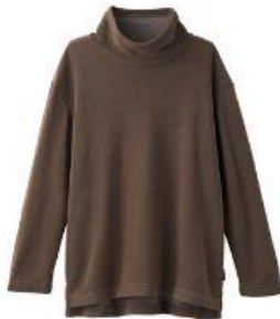
オフタートルネック 17,600円（税込）