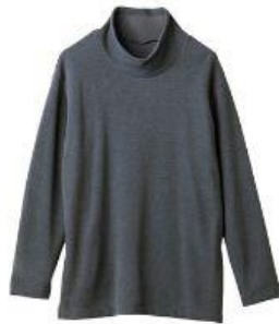
オフタートルネック 17,600円（税込）