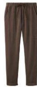
ロングテーパーパンツ 17,600円（税込）