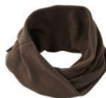
ヒートスヌード 6,380円（税込）