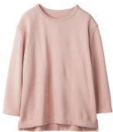
クルーネックプルオーバー 15,400円（税込）