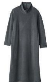
オフタートルネックワンピース 22,000円（税込）