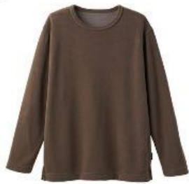
クルーネックプルオーバー 16,500円（税込）