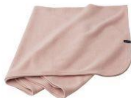
ヒートブランケット 13,200円（税込）