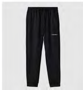
ブラック 全グレー ロングパンツ [8163] ¥15,400(税込) Size:M/L

◆TEXTILE:もっちりとした感触で、シワになりにくい段ボール構造の素材。やわらかなストレッチ性と吸水機能で肌ざわりはサラッと着ごちらくちん。フードや襟がキレイに立つよう、ハリのある素材に仕上げました。◆FUNCTION:吸水 / UPF50+ ◆組成:ポリエステル 100%