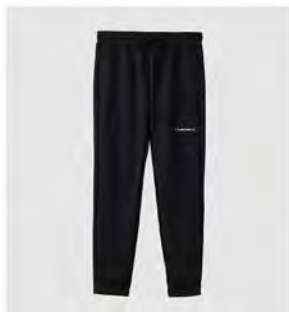
ブラック 全グレー ロングパンツ [8113] ¥15,400(税込) Size:M/L/XL/XXL