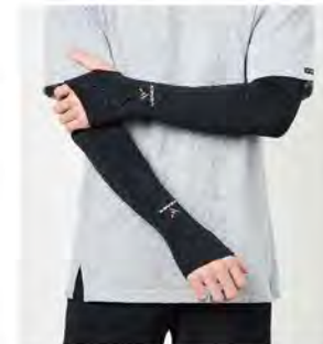
ブラック ロングアームカバー [6125] ¥5,280(税込) Size:M 丈40cm / 腕幅20-26cm L 丈43cm / 腕幅25-32cm