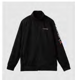
ブラック 全グレー ジップアップ ジャケット [8112] ¥17,600(税込) Size:M/L/XL/XXL