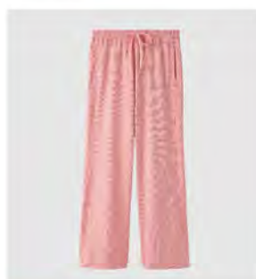
サクラ ネイビー フレアパンツ [6583] ¥18,700 (税込) Size: M/L/XL

◆TEXTILE: 蜂の巣のように立体的な構造で表裏の両面に凹凸感のある素材。メッシュ調で吸水性に優れているため、汗をかいてもベタつかず、サラッとしたドライな着ごちが続きます。◆FUNCTION: 吸水速乾 / 全方位ストレッチ ◆組成: ポリエステル 90% / ポリウレタン 10%