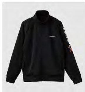
ブラック 全グレー ジップアップ ジャケット [8162] ¥17,600(税込) Size:M/L