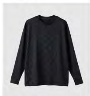
ブラック ネイビー ロングスリーブ クルーネック [6570] ¥17,600 (税込) Size: M/L/XL/XXL