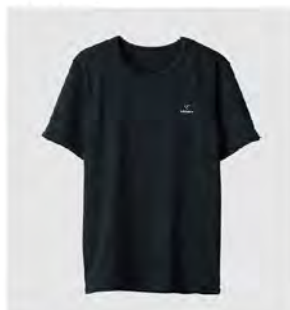
ブラック Tシャツ [6705] ¥9,900(税込) Size: M/L/XL/XXL