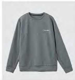
全グレー クルーネック スウェット [8160] ¥14,300(税込) Size:M/L