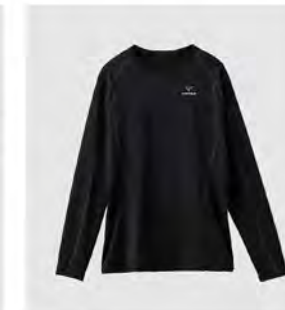
ブラック×ブラック ロングスリーブ [6435] ¥13,200(税込) Size: M/L