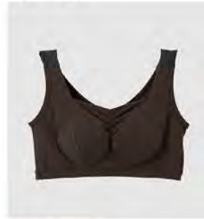
スモーキー モカ ピンク シャーリングブラ(パッド付き) [8780] ¥6,820(税込) Size:M/L