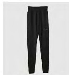
ブラック レギンス [8104] ¥13,200(税込) Size:M/L