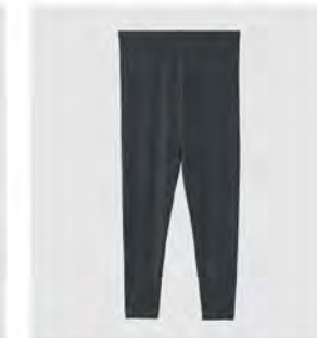
スモーキー モカ ピンク チャコール レギンス [8768] ¥9,900(税込) Size:M/L