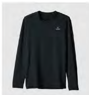
ブラック Tシャツロングスリーブ [6732] ¥11,000(税込) Size: M/L/XL/XXL