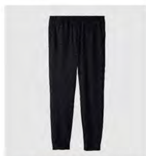
ブラック ネイビー ジョガーパンツ [6571] ¥18,700 (税込) Size: M/L/XL/XXL