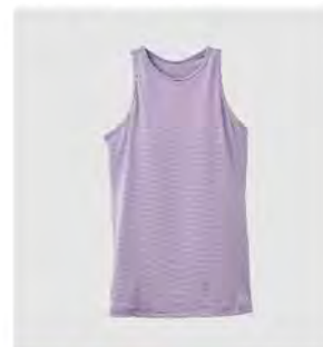
ラベンダー コーラル カップ付きタンクトップ [8100] ¥13,200(税込) Size:M/L