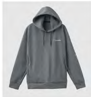
全グレー フーディー [8161] ¥16,500(税込) Size:M/L