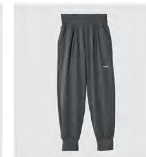
チャコール 8分丈ジョガーパンツ [8103] ¥14,300(税込) Size:M/L