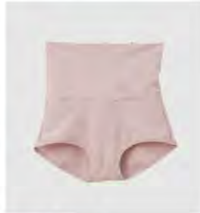
スモーキー モカ ピンク ゴムなしボディショーツ [8783] ¥6,380(税込) Size:M/L