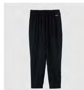
ブラック 8分丈テーパーパードパンツ [6738] ¥11,000(税込) Size: M/L/XL