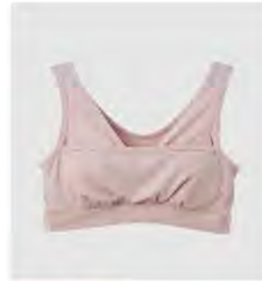
スモーキー モカ ピンク ギャザリングブラ(パッド付き) [8781] ¥7,480(税込) Size:M/L