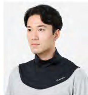
ブラック ネックカバー [6961] ¥5,280(税込) Size:Free