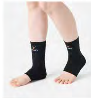
ブラック アングルコンフォート [6120] ¥3,190(税込) Size:M 足首周り20-26cm L 足首周り24-30cm