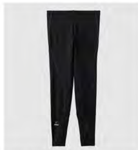
ブラック×ブラック ロングタイツ [6433] ¥13,200(税込) Size: M/L/XL/XXL