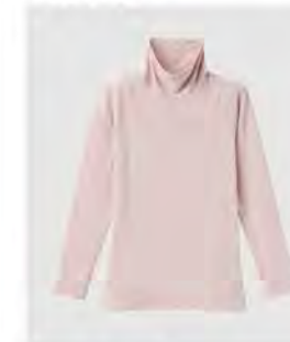
スモーキー モカ ピンク タートルネック9分袖 [8766] ¥11,000(税込) Size:M/L