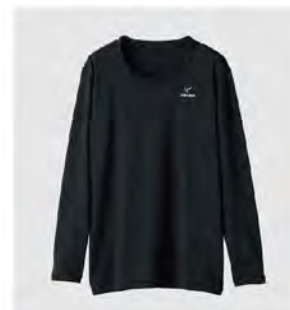
ブラック Tシャツロングスリーブ [6734] ¥11,000(税込) Size: M/L/XL