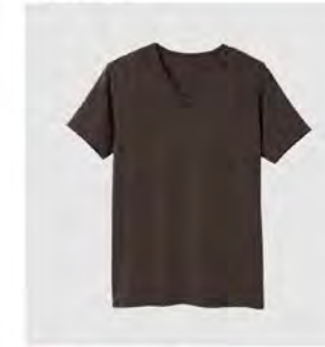
モカ チャコール Vネック半袖 [8716] ¥8,800(税込) Size:M/L