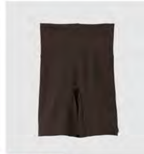
スモーキー モカ ピンク ゴムなしボディショーツ4分丈 [8784] ¥7,480(税込) Size:M/L