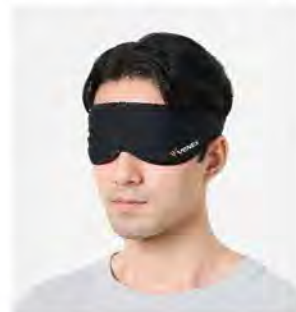
ブラック アイマスク [6106] ¥3,190(税込) Size:S-M 目幅47-54cm L-XL 目幅53-62cm

◆組成:ポリエステル 90% / ポリウレタン 10% (リカバリークロスプラス)、ポリエステル 84% / ポリウレタン 16% (アクセサリその他)