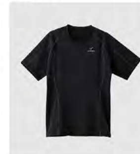
ブラック×ブラック ショートスリーブ [6434] ¥9,900(税込) Size: M/L