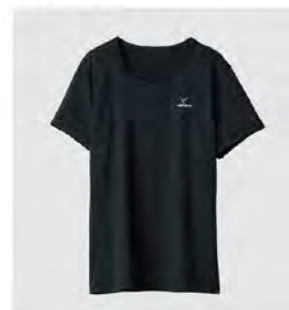
ブラック Tシャツ [6706] ¥9,900(税込) Size: M/L/XL