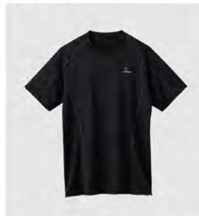
ブラック×ブラック ショートスリーブ [6430] ¥9,900(税込) Size: M/L/XL/XXL