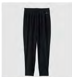
ブラック ロングテーパーパードパンツ [6737] ¥11,000(税込) Size: M/L/XL