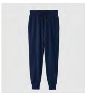
サクラ ネイビー ジョガーパンツ [6582] ¥18,700 (税込) Size: M/L/XL