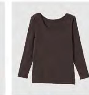
スモーキー モカ ピンク Uネック9分袖 [8767] ¥9,900(税込) Size:M/L