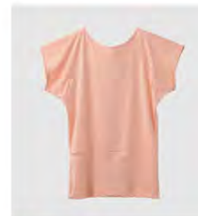
ラベンダー コーラル バックオープンTシャツ [8101] ¥13,200(税込) Size:M/L