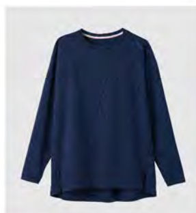
サクラ ネイビー ボートネック ロングスリーブ [6581] ¥17,600 (税込) Size: M/L/XL