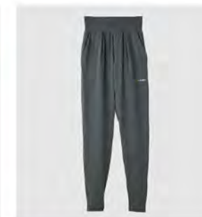
チャコール ロングテーパーズパンツ [8102] ¥14,300(税込) Size:M/L