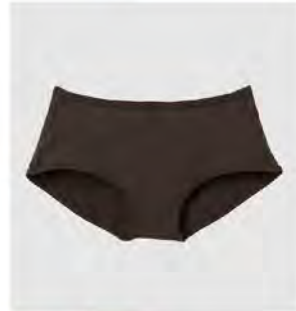
スモーキー モカ ピンク ゴムなしショーツ [8782] ¥3,520(税込) Size:M/L