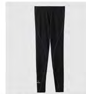
ブラック×ブラック ロングタイツ [6437] ¥13,200(税込) Size: M/L

◆TEXTILE: やわらかな質感としなやかな動きで、からだの動作にストレスなくついていく伸縮性を持つ素材。表側に光沢感があり、ツルつとなめらかな質感。吸収した汗を素早く乾燥させることにも優れています。◆FUNCTION: 吸水速乾 / 全方位ストレッチ ◆組成: ポリエステル 84% / ポリウレタン 16%