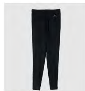
ブラック レギンスプラス [6736] ¥11,000(税込) Size: M/L/XL

◆TEXTILE: やわらかな質感としなやかな動きで、からだの動作にストレスなくついていく伸縮性を持つ素材。表側に光沢感があり、ツルつとなめらかな質感。吸収した汗を素早く乾燥させることにも優れています。◆FUNCTION: 吸水速乾 / 全方位ストレッチ ◆組成: ポリエステル 84% / ポリウレタン 16%