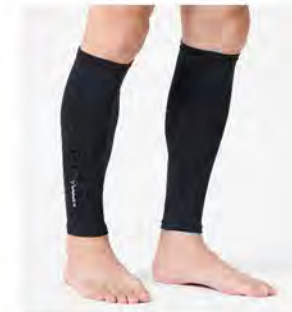
ブラック レッグコンフォート [6113] ¥4,950(税込) Size:M 丈40cm / 足幅30-37cm L 丈43cm / 足幅34-42cm