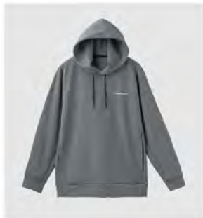
全グレー フーディー [8111] ¥16,500(税込) Size:M/L/XL