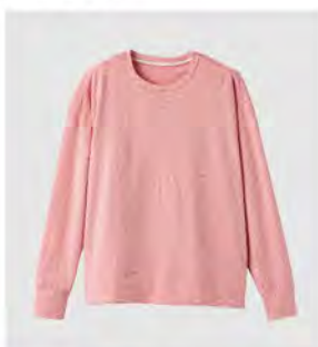
サクラ ネイビー ロングスリーブ クルーネック [6580] ¥17,600 (税込) Size: M/L/XL