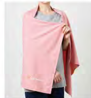
サクラ ブラック ネイビー リカバリークロスプラス [6123] ¥11,000(税込) Size:幅130cm / 丈70cm