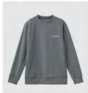
全グレー クルーネック スウェット [8110] ¥14,300(税込) Size:M/L/XL