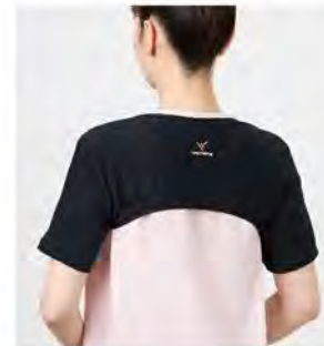
ブラック ショルダーカバー [6126] ¥5,280(税込) Size:S-M 肩幅34-44cm L-XL 肩幅40-50cm