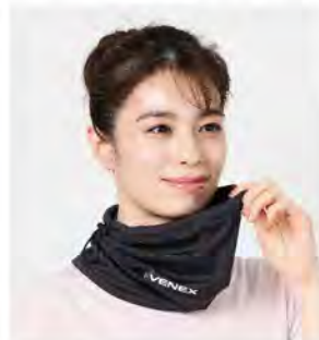
ブラック 2WAYコンフォート [6114] ¥3,960(税込) Size:Free 幅27cm / 丈26cm