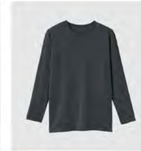
モカ チャコール クルーネック9分袖 [8717] ¥9,900(税込) Size:M/L