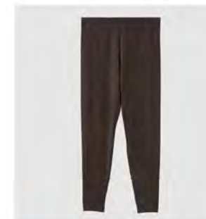
モカ チャコール レギンス [8718] ¥9,900(税込) Size:M/L