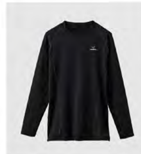
ブラック×ブラック ロングスリーブ [6431] ¥13,200(税込) Size: M/L/XL/XXL